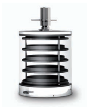
Cámara con dispositivo de cerrado al vacío