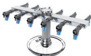
Manifold de 12 tomas con adaptador