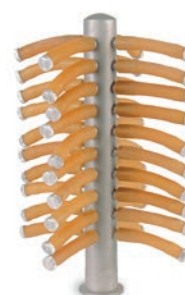
Manifold de 40 tomas